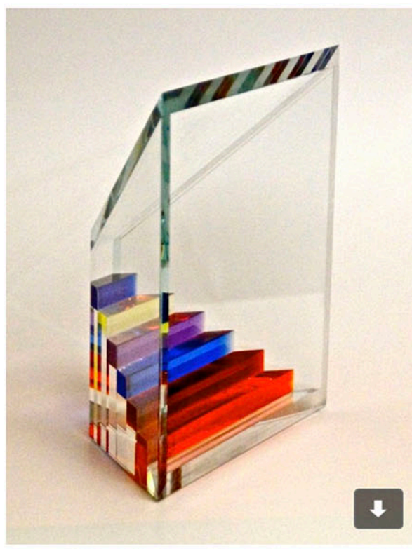
Galerie De Aventurijn 8 gerenommeerde GLASKUNSTENAARS